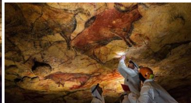
Igra s bikom, freska Freska iz vile Misterija